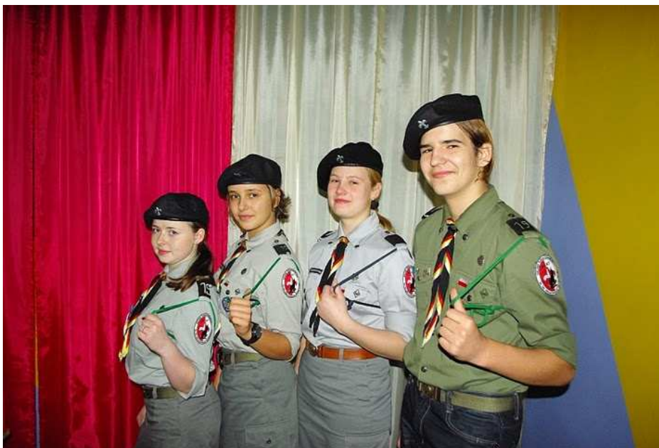
Nowa kadra 19 MDH Mafeking