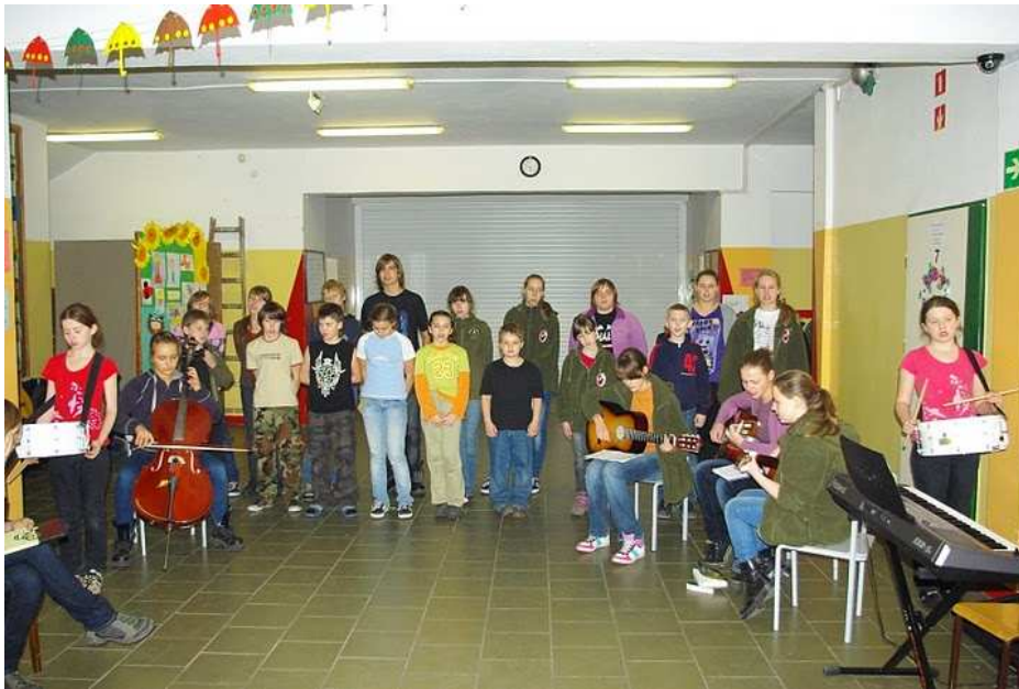
Przygotowania do festiwalu złota nutka